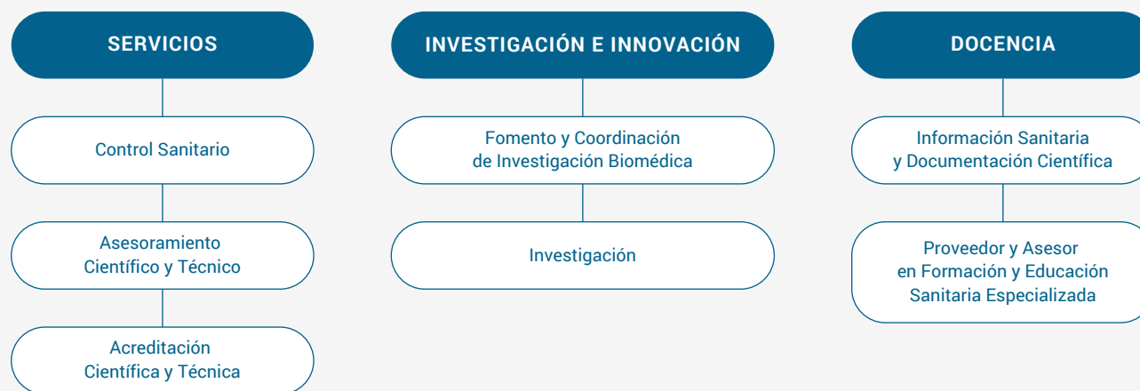
Figura 1. Funciones del ISCIII

RD 375/2001, de 6 de Abril. Estatuto del Instituto de Salud "Carlos III" BOE-A-2001-8157, Artículo 4