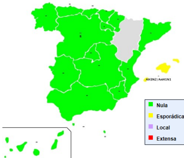
Figura 1. Nivel de difusión de la gripe. Semana 43/2019. Temporada 2019-20. España