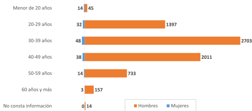
Figura 1. Nº de casos por grupos de edad y sexo

La distribución por edad y sexo se muestra en la figura 1.